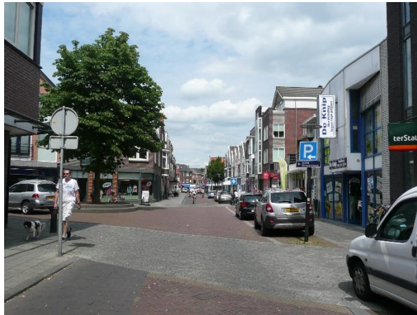
Foto-impresie Boxbergerweg in Deventer